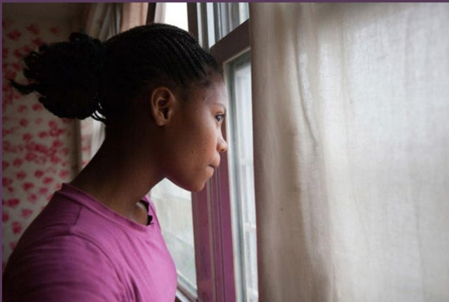
▪ High rise , la vida desde las torres del mundo.

Cada rincón revela una faceta del personaje y su vida en el lugar. Pinchando en determinados espacios u objetos, se accede a breves videos donde cada uno describe su experiencia urbana y las vistas desde sus ventanas en Chicago (USA); Toronto y Montreal (Canadá); La Habana (Cuba); Sao Paulo (Brasil); Ámsterdam (Holanda), Estambul (Turquía); Beirut (El Líbano), Bangalore (Tailandia); Phnom Penh (Camboya); Praga (República Checa), Johannesburgo (Sudáfrica) y Tainan (Taiwán).