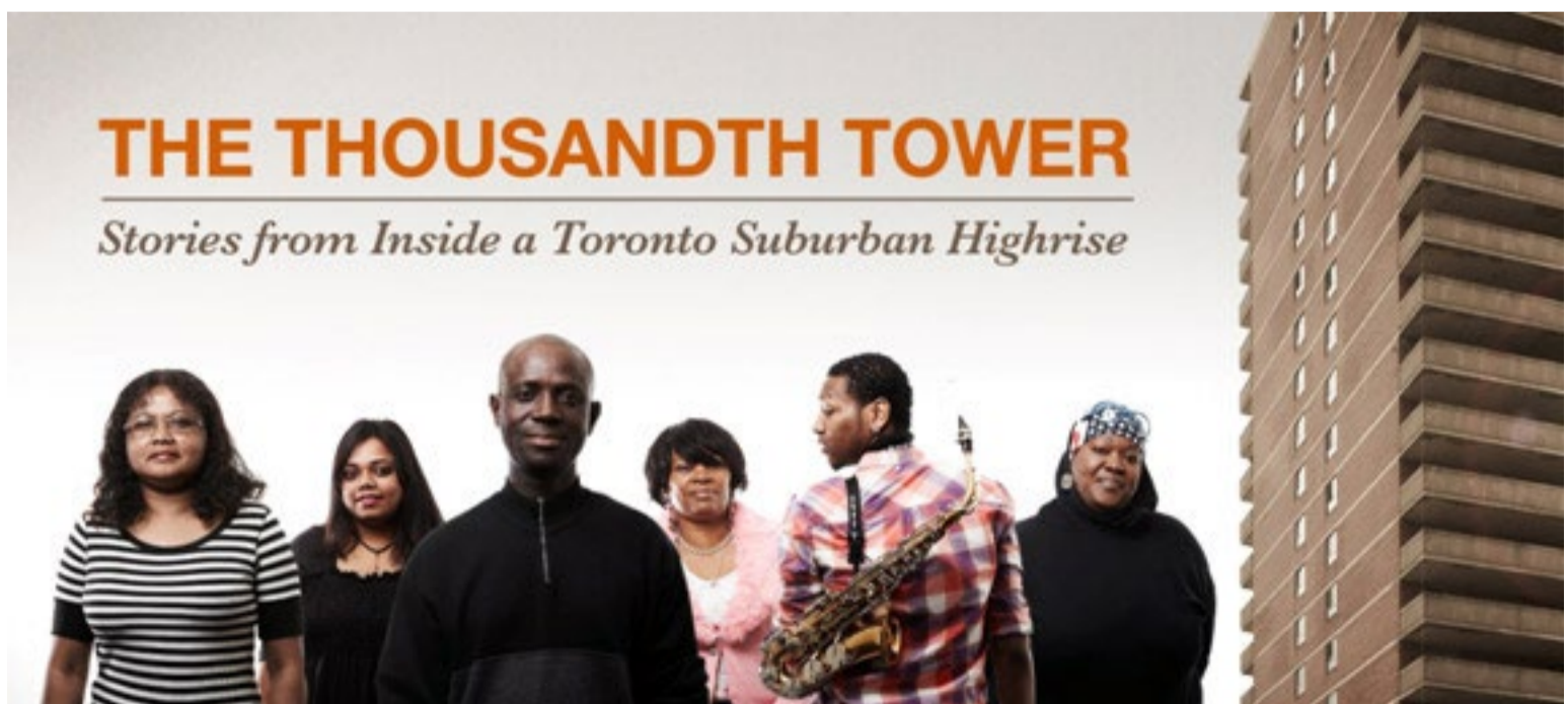
■ The thousandth tower.

High rise no esconde su finalidad social: usar los medios digitales para explorar la vida en las torres, pero no sólo para documentarla, sino para cambiarla.