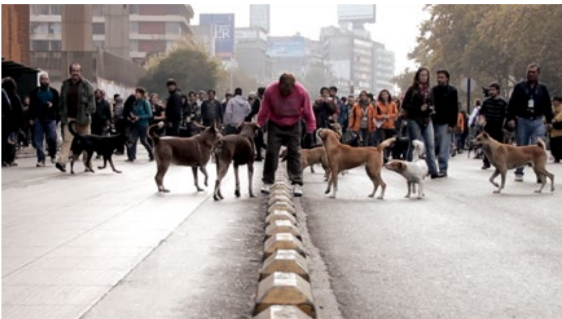
▪ La marcha de los perros.

Los registros son en general en espacios comunes: calles, mercados, estadios, parques. Lo importante es la mirada, que busca capturar lo que sucede y poner en cuestión y en tensión lo observado. Develar, a la larga, los contrastes propios de la identidad nacional.