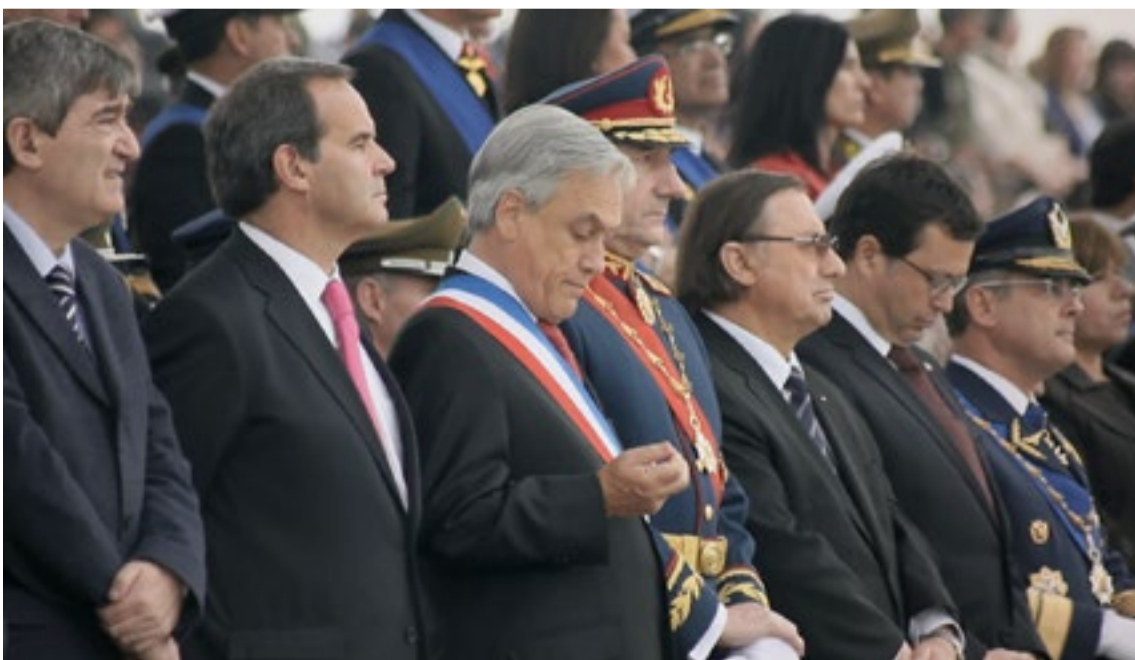
▪ Parada militar.

Circulan por la red. Por caminos infinitos. Como decía Murray: “un mapa inacabable”.