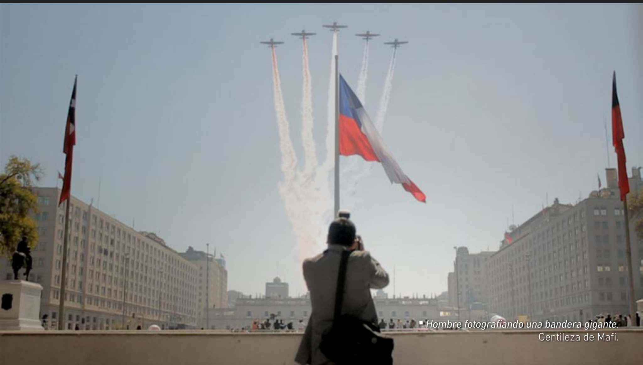
▪ Hombre fotografiando una bandera gigante.

Actualmente hay más de 100 piezas documentales en Mafi, de un minuto de duración promedio. Todos registros actuales, retratos del Chile de hoy y sus contradicciones. “Nos gusta pensar el país desde lo que sus imágenes están expresando”, apunta Murray, “y nuestro objetivo es aportar a la memoria audiovisual del país”.